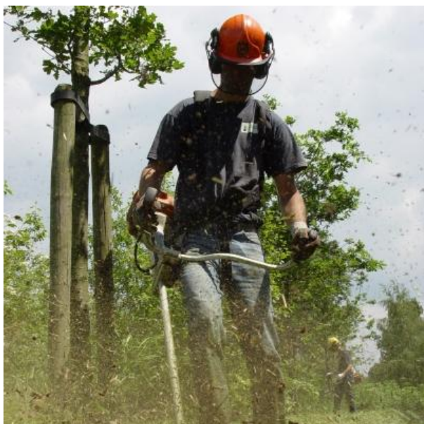
CO 2 Prestatieladder versie 3.1 (trede 5)