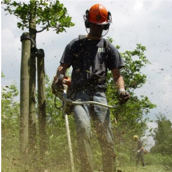
CO 2 Prestatieladder versie 3.1 (trede 5)